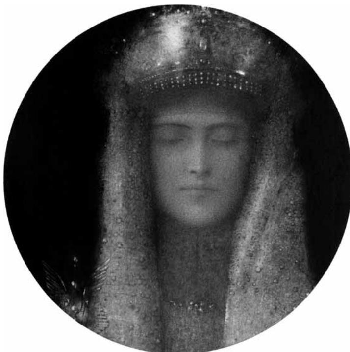
Odilon Redon (1858 - 1921), Stille, Museum of Modern Art, New York

entdeckte nicht nur unendlich viel in der Musik, sondern auch bei mir selbst und fand beim wiederholten Hören heraus, mit welcher Stelle in der Musik welches Gefühl verbunden war und vieles mehr. Geblieben ist mir von diesem Seminar vor allem die Erkenntnis, dass achtsames meditatives Musikhören eine Erweiterung des Bewusstseins mit sich bringt. Eine Erkenntnis, die übrigens auch die anderen Seminarteilnehmer teilten. So äußerte ein Musiker, dass er den Unterschied zwischen konzentriertem Hören, bei dem all das kritische musiktheoretische Wissen mitspielt, und achtsamem oder meditativem Hören in diesen Tagen verstanden habe.